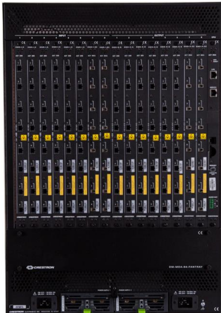
DM-MD64X64 — вид сзади с установленными входными/выходными блейд-модулями

Для просмотра зашифрованного с помощью HDCP контента требуется проверка подлинности устройством-источником всех дисплеев и блоков обработки сигналов в системе с последующей выдачей им ключа перед просмотром контента. Обычно это приводит к полному исчезновению сигнала на время до 15 секунд при выборе нового источника или дисплея в любом месте системы.