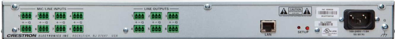
DSP-860 – Вид сзади