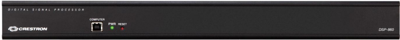
DSP-860 – Вид сзади